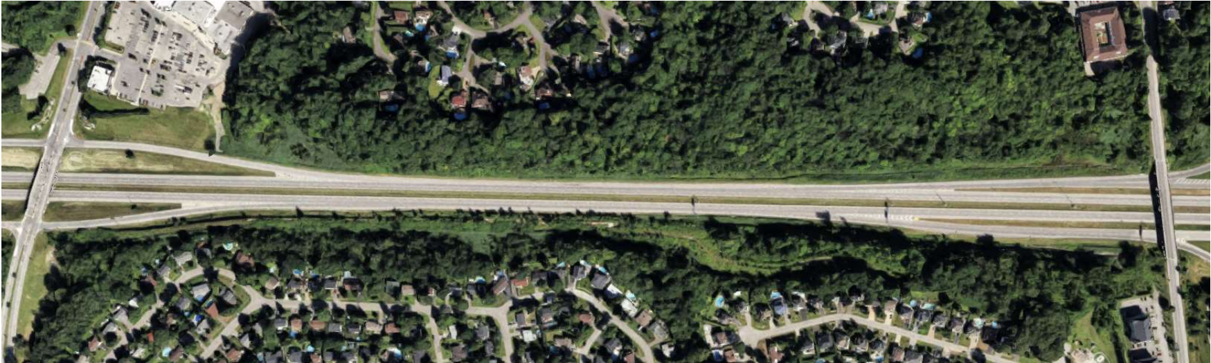
Schéma du reseau (fichier .net.xml ) :